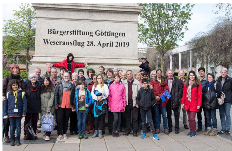
Alle drei Projekte gemeinsam unterwegs

..... ÜBERNEHMEN SIE EINE CHANCEN-PATENSCHAFT