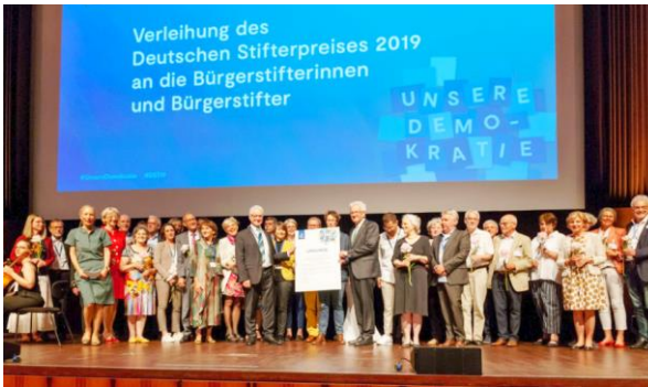
Preisverleihung Deutscher Stifterpreis in Mannheim

Die Bürgerstiftung Göttingen nahm in Person des Geschäftsführers an den Vernetzungsangeboten des Bundesverbands Deutscher Stiftungen, der Aktiven Bürgerschaft e.V. und der Lotto Sport Stiftung Niedersachsen teil, insbesondere durch Fachtagungen in Erfurt, Kassel, Hannover und Berlin. Besonderer Höhepunkt war die Auszeichnung von 30.000 Bürgerstifterinnen und -stiftern mit dem Deutschen Stifterpreis, verliehen am 5. Juni 2019 im Rahmen des Deutschen Stiftungstags in Mannheim. Etwa 300 Personen nahmen diese besondere Würdigung des Bürgerstiftungsgedankens durch die gesamte „Stiftungswelt“ persönlich entgegen.